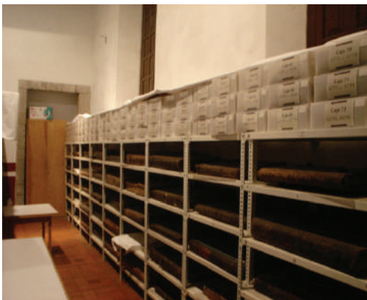
Fig. 24. Vista parcial de la ubicación temporal del archivo de música en la Librería coral localizada en el Salón de los Quemados.