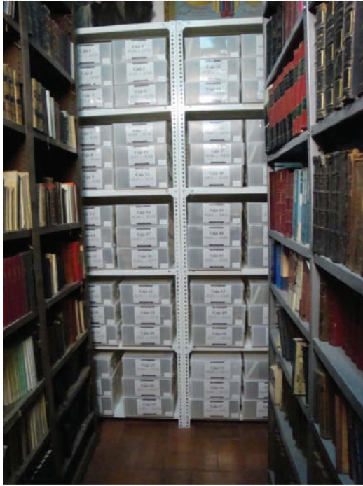
Fig. 20. Vista parcial del archivo de música después de su organización.