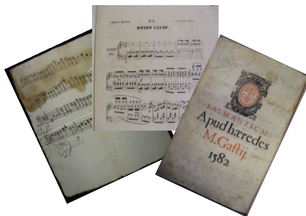
Fig. 28. Una parte de acompañamiento de un villancico manuscrito, una primera página de una pieza para piano impresa y la portada de un libro correspondiente a la obra más antigua del archivo de música (actualmente reubicada en la Librería coral ).