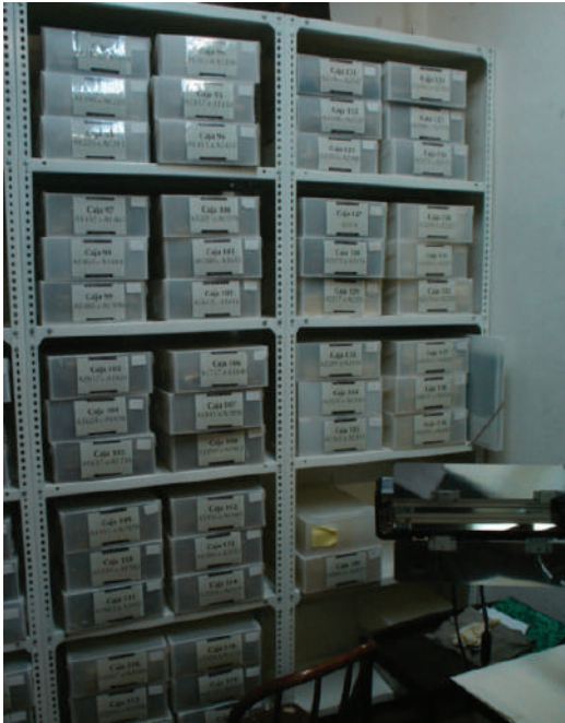
Fig. 22. Ubicación de una parte del archivo de música antes de la aparición de goteras.