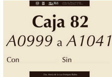
Fig. 21. Ejemplo de las etiquetas en las guardas de segundo nivel que indican las signaturas de las obras que contiene la caja.

El día 24 de julio del 2010 se detectó una filtración de agua en el techo del archivo. Esto originó la afectación de dos expedientes de papeles de