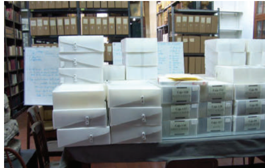
Fig. 23. Cajas del archivo de música colocadas provisionalmente en las mesas de trabajo para evitar daños mayores.